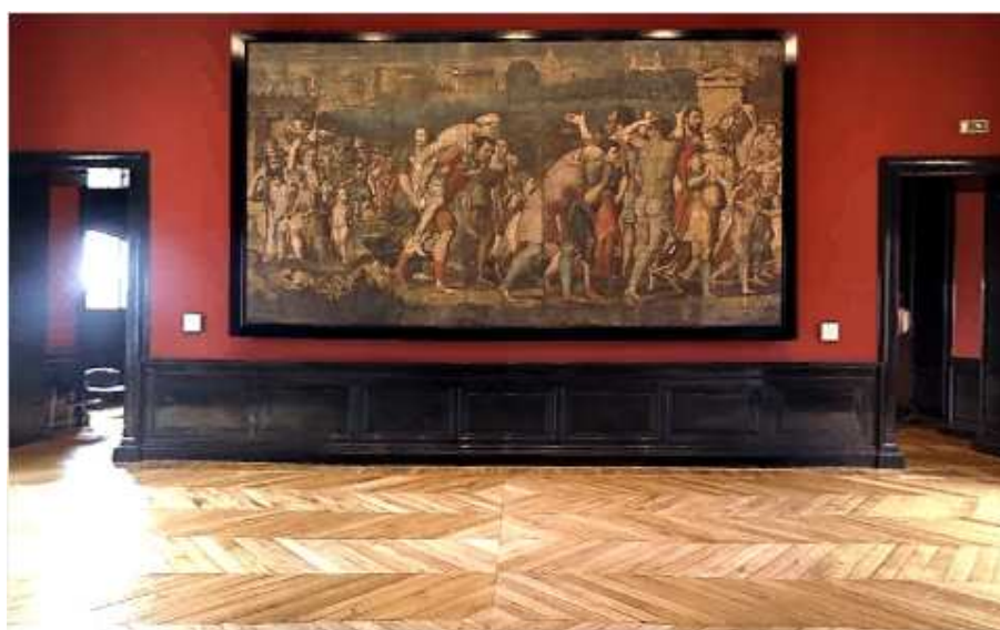
Cameră pentru tipărituri și desene