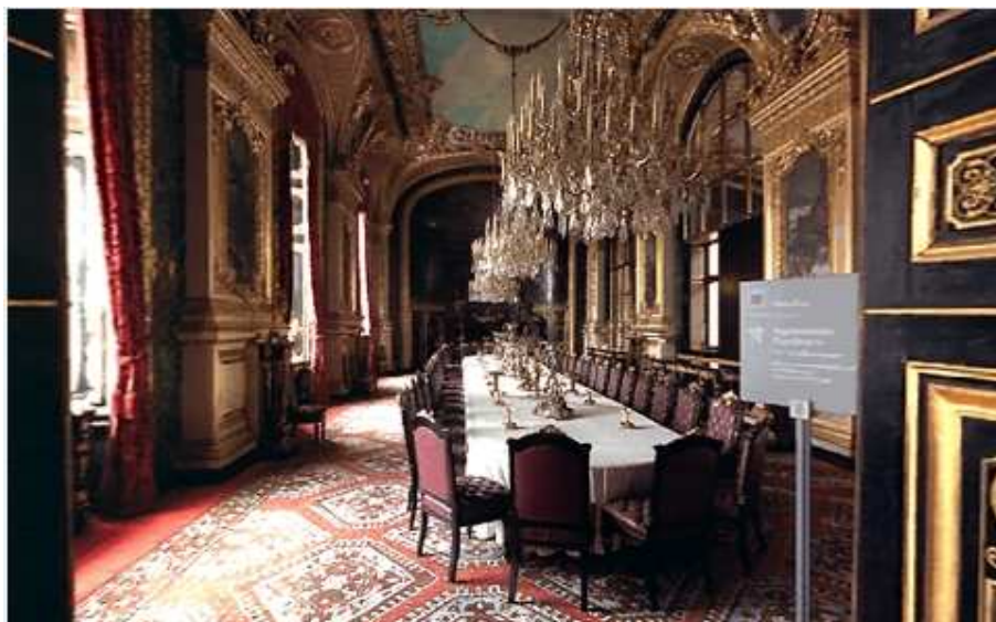
Apartamentul lui Napoleon al III-lea