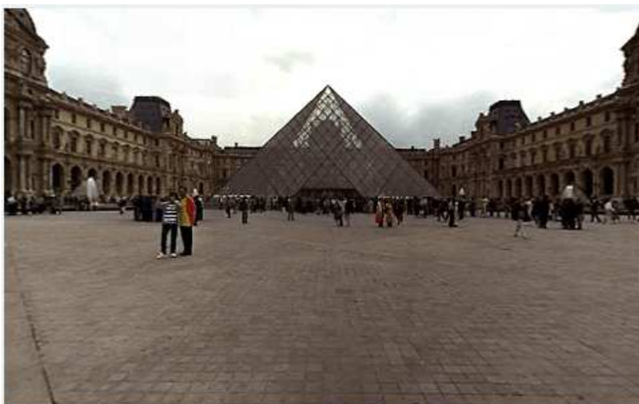
Piramida din sticla

Muzeul Luvru (Musée du Louvre în franceză) este cel mai mare muzeu parizian, după suprafață și printre cele mai cunoscute muzee din lume. Clădirea este un fost palat regal situat în inima orașului Paris, între malul drept al râului Sena și Rue de Rivoli. Curtea sa principală se află pe axa bulevardului Champs-Élysées.