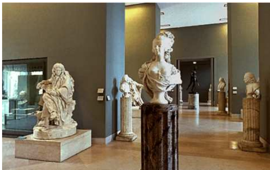
Cameră destinată sculpturilor marilor oameni ai Franței