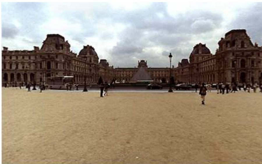
Esplanada din fața muzeului

Inițial, Luvru a fost o fortăreață medievală în 1200, după care a devenit rezidența regală sub domnia lui Carol al V-lea, în 1365. Curînd după aceea a fost modernizat după gustul renesantist de către Francisc I în 1546. De-a lungul secolelor a fost extins, distrus sau transformat sub domniile succesive ale lui Henric al IV-lea, Ludovic al XIII-lea, Ludovic al XIV-lea, Napoleon I și Napoleon III. Arhitectura sa este o îngemănare de stiluri care stau mărturie a mai mult de 800 de ani de istorie.