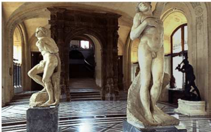
Camera cu sculpturile lui Michelangelo