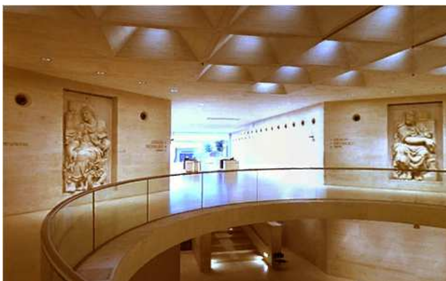
Rotonda care are camere în care este prezentată istoria muzeului

În zilele noastre, Muzeul găzduiește istoria artei lumii occidentale, începând cu Evul Mediu, pînă în secolul al XIX-lea, alături de civilizații antice care au precedat și au inspirat cultura vestică.