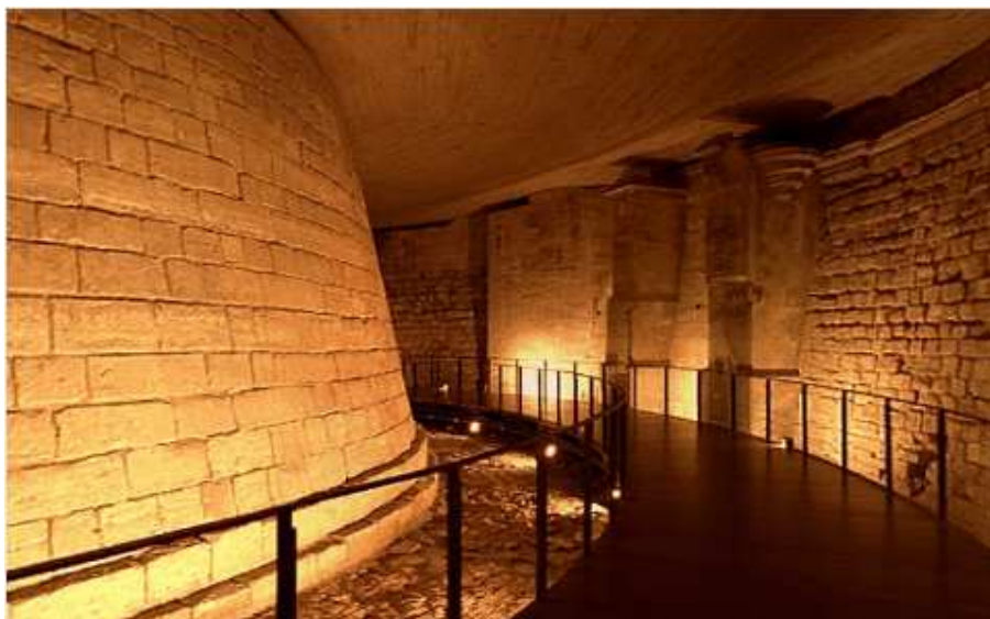
Închisoarea din marele turn