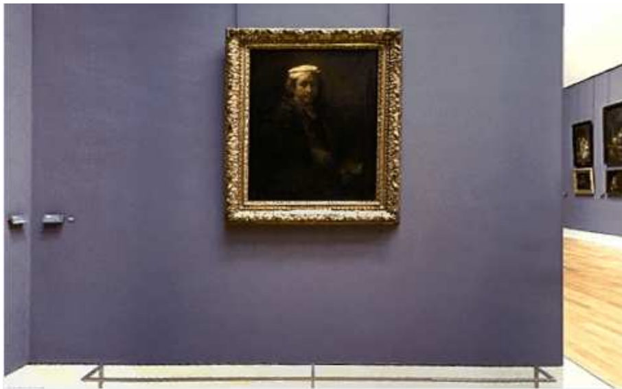
Camera destinată picturilor lui Rembrndt