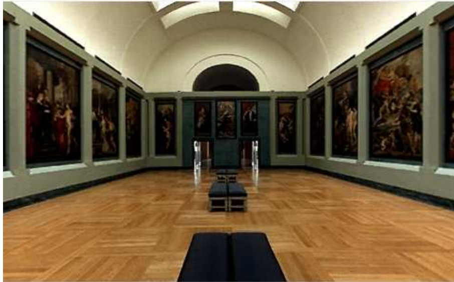
Camera familiei Medici