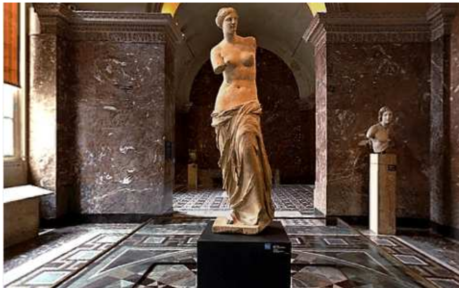
Venus din Milo

Zeița Venus are dedicată o întreagă cameră.