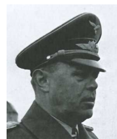
Albert Kesselring (1885-1960)