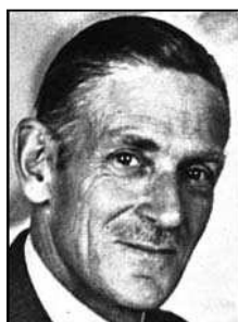
Sir Keith Rodney Park (1892-1975)