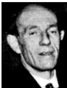
Lord Edward Frederick Lindley Wood Halifax (1881-1959)

Fiind unul dintre cei mai importanți lideri ai secolului XX, sir Winston Leonard Spencer Churchill și-a început cariera drept corespondent de război ( în cadrul războiului cu burii). Devenind celebru după capturarea și eliberarea sa de către inamic, s-a lansat în politică, fiind ales în Partidul Conservator, la zece luni după întoarcerea sa de pe front. În 1904 are să se alăture Partidului Liberal, urmând să fie numit în repetate rânduri (din 1906) ca ministru de război. Este din nou primit în cadrul Partidului Conservator, în 1927, devenind liderul acestuia, în 1940. În același an, Churchill a devenit șef al guvernului de coaliție, păstrându-și funcția până la sfârșitul celui de-al doilea Război Mondial.