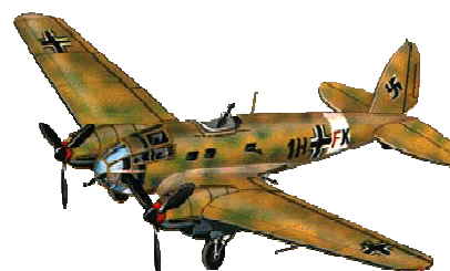
Heinkel HE III (Germania)