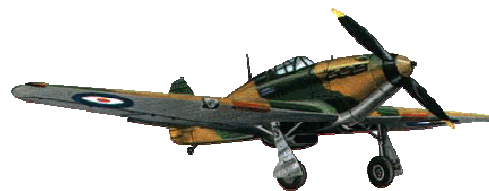
Hawker Hurricane (Marea Britanie)