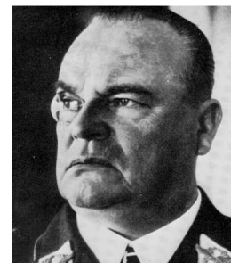
Hugo Sperrle (1885-1953)