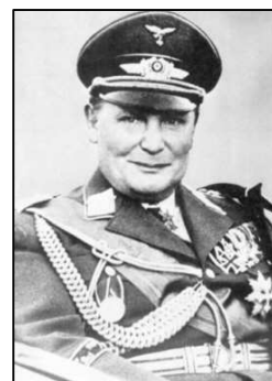
Hermann Göring (1893-1946)