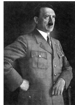
Adolf Hitler (1889-1945)

Pe data de 19 iulie, înainte de stabilirea datei operațiunii, Hitler, în cuvântarea ținută cu ocazia victoriei în războiul de vest, face un apel demagogic către guvernul britanic, pentru găsirea unei căi de restabilire a păcii. A doua zi, răspunsul guvernului britanic a fost transmis de lordul William Halifax : „Germania va obține pacea numai dacă va evacua toate teritoriile ocupate, va reinstaura toate libertățile pe care le-a distrus și va da garanții pentru viitor”.