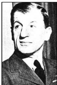
Sir Charles Frederick Algernon Portal (1893-1971)

august). Churchill, privind flăcările care cuprindeau Londra, a decis: „De mâine Bomber Command (Comandamentul de Bombardament) va riposta aidoma asupra Berlinului”.