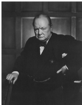
Sir Winston Churchill (1874-1965)

Fiind unul dintre cei mai importanți lideri ai secolului XX, sir Winston Leonard Spencer Churchill și-a început cariera drept corespondent de război ( în cadrul războiului cu burii). Devenind celebru după capturarea și eliberarea sa de către inamic, s-a lansat în politică, fiind ales în Partidul Conservator, la zece luni după întoarcerea sa de pe front. În 1904 are să se alăture Partidului Liberal, urmând să fie numit în repetate rânduri (din 1906) ca ministru de război. Este din nou primit în cadrul Partidului Conservator, în 1927, devenind liderul acestuia, în 1940. În același an, Churchill a devenit șef al guvernului de coaliție, păstrându-și funcția până la sfârșitul celui de-al doilea Război Mondial.