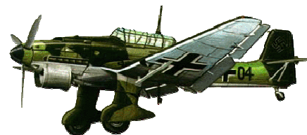
JU.87 Stuka (Germania)

Englezii, în confruntarea lor cu Germania lui Hitler, erau conștienți de mijloacele slabe de care dispuneau. Însă, prin idealismul lui Churchill și strategia mareșalului Dowding, de a raționaliza forța armată de care dispunea Regatul, „ Cei Pușini ”, după cum erau numiți piloții în ale căror mâini zăcea