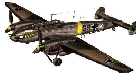
Messerschmitt ME.110 Zerstörer (Germania)