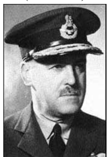
Sir Trafford Leigh Mallory (1892-1944)

Astfel, datorită unui conflict de opinii, Hitler a luat decizia ca invazia să fie amânată până când forța aeriană britanică va fi distrusă. Directiva 17, semnată la 1 august 1940, menționa începera acestei ofensive la 6 august și încheierea victorioasă la 21 septembrie.