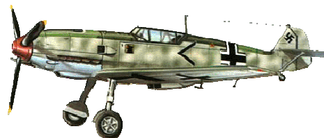
Messerschmitt BF.109 (Germania)