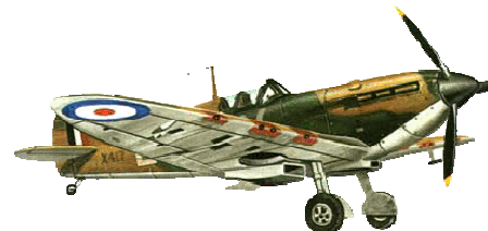
Supermarine Spitfire MK. II (Marea Britanie)