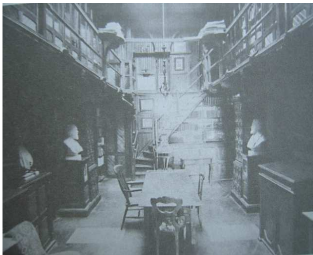
Una din bibliotecile de la Florica

Cât a trăit Ionel Brătianu „nimeni nu s-a atins de stocurile de la Florica”, după 1927 au început sa fie risipite, in curând alegându-se „praful” de acestea. Sugestivă pentru soarta bibliotecii Brătianu este întrebarea retorică a