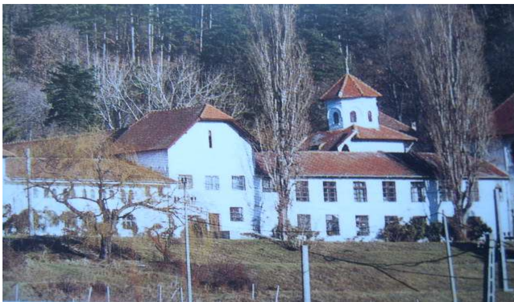
Ferma conacului de la Florica

A doua componentă de bază a ansamblului de la Florica a constituit-o ferma, situată chiar la intrarea în parc, pe partea stânga. Monumentala clădire a fermei este opera arhitectului Petre Antonescu din anii 1905-1912, fiind construită pe două nivele în stil neoromânesc. Semănând izbitor cu marile noastre ansambluri mănăstirești, ferma de la Florica formează printre cele patru laturi ale sale, o curte interioară, în mijlocul căreia se află o fântână arteziană.