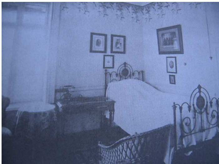
Dormitorul lui Ion C. Brătianu de la Florica in 1892

Ion C. Brătianu, „Vizirul”, cum era cunoscut in epoca a menținut casa cu un stil sobru, impus de gusturile sale simple. Spre sfârșitul vieții, a fost convins cu greu sa de fiul său Ionel, inginer împătimit de construcții, sa schimbe stilul vechi al casei.