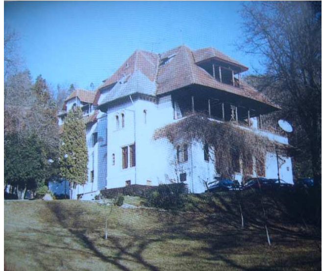
Conacul Brătianu de la Florica

Acesta este conacul în care s-a născut și a trăit cea mai importantă familie de oameni politici români, o adevărată dinastie civilă care a dat țării nu mai puțin de trei prim-miniștrii, dintre care primii doi - Ion și Ionel Brătianu - au avut un rol covârșitor în formarea României moderne. Ion Brătianu a dus la războiul de independență al României, iar cel de-al doilea a realizat, tot în urma unui război, Unirea din 1918 și reformele ce au stat la baza democrației interbelice.