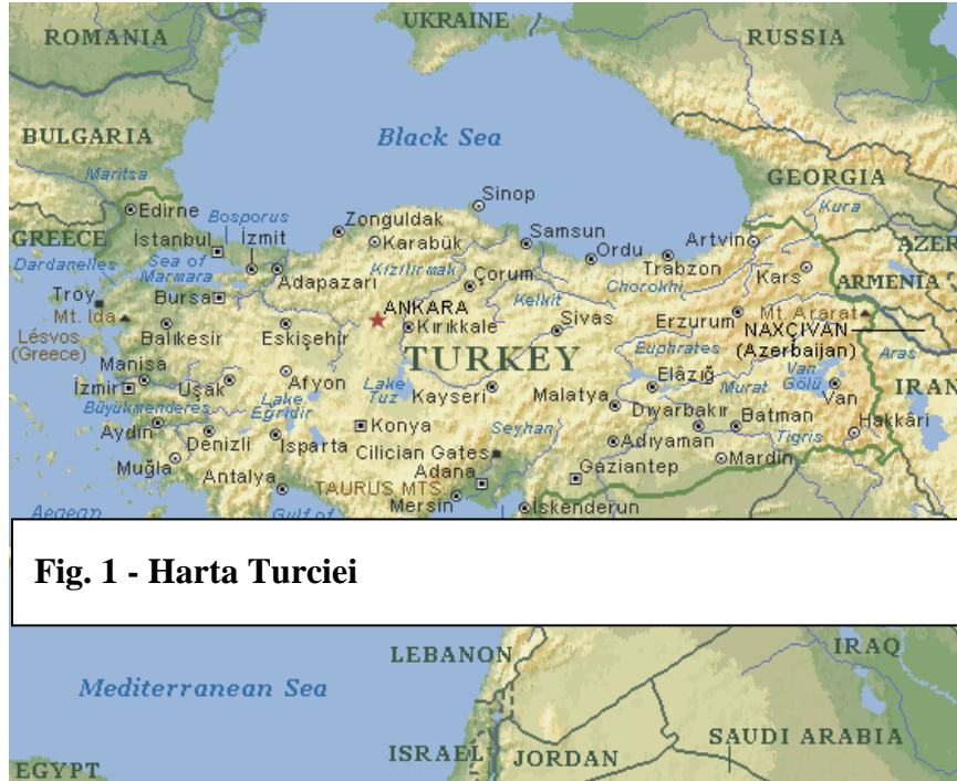
Fig. 1 - Harta Turciei

Turcia este situată în sud-estul Europei și sud-vestul Asiei. Se învecinează la nord-vest cu Bulgaria și Grecia, la nord cu Marea Neagră, în nord-est cu Georgia și Armenia, în est cu Iran și Azerbaidjian, în sud cu Iraq, Siria și Marea Mediterană și în vest cu Marea Egee. Suprafața este de 779.452 km. 2 și capitala este la Ankara.