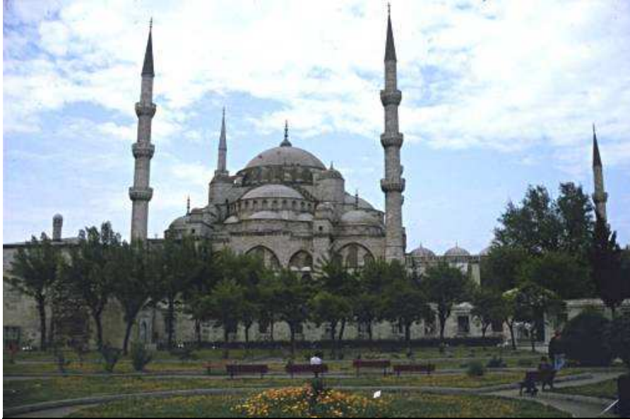
Fig. 6- Moscheea Souleimanyie

sfert din exporturi), SUA, Rusia, Marea Britanie și Italia. Sursele de import sunt Germania, Italia, SUA, Franța și Marea Britanie. Turcia este membru asociat al Uniunii Europene.