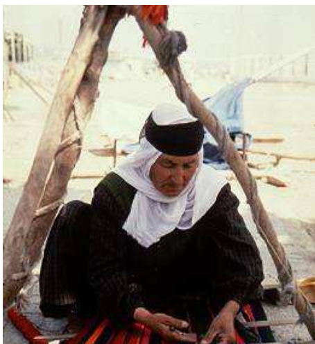
Fig. 5- haine traditionale