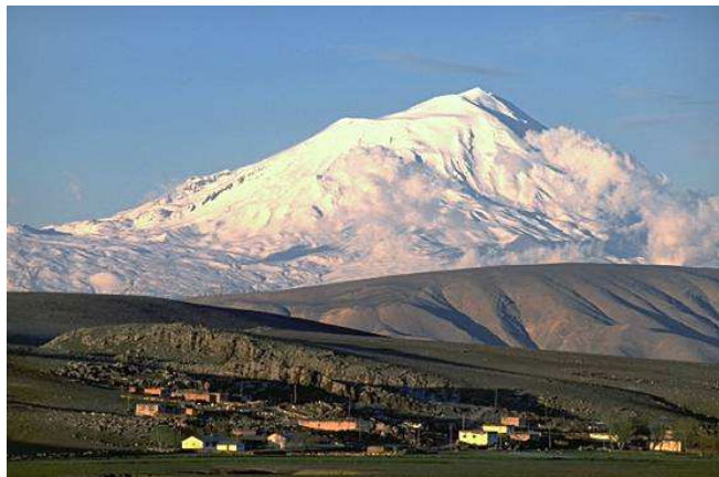
Fig. 2- muntele Ararat

Thrace și litoralul Mării Marmara sunt regiuni bine irigate și mai mult de un sfert este cultivată. Litoralul Mării Egee și regiunea Mediteraneană sunt înguste și deluroase și doar o cincime este arabil. Spre est, o mare parte din cultura de bumbac a Turciei crește în Çukurova, o câmpie conectată cu interiorul prin Munții Taurus cu o trecătoare cunoscută din antichitate ca Porțile Ciliciene.