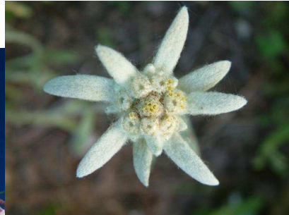
Garofita Pietrei Craiului