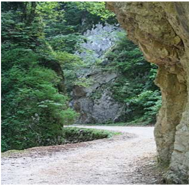
Prapastiile Zarnestilor Crapaturii