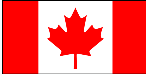
Steagul oficial al Canadei

Deviză națională: A Mari Usque Ad Mare ( De la un ocean la altul în latină)