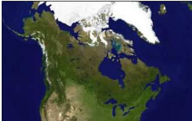
Vedere din satelit a Canadei.

Pădurile boreale domină întinderea țării, ghețarii sunt proeminenți în regiunea arctică și în Munții Stâncoși, în timp ce terenul relativ plat al preeriilor este propice pentru agricultură. Marile Lacuri alimentează Fluviul Sfântul Laurențiu (St. Lawrence) (în sudest) o zonă care găzduiește o mare parte din populația Canadei.