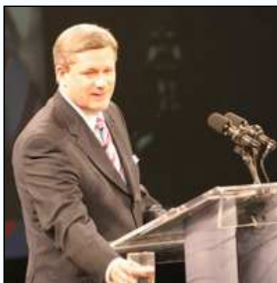
Stephen Harper, Prim-ministrul Canadei