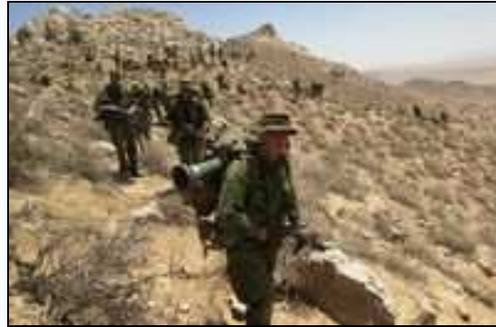
Soldați canadieni în Afganistan.

patra puterea militară a lumii, cu efective mult în spatele Statelor Unite, Marii Britanii și Uniunii Sovietice.