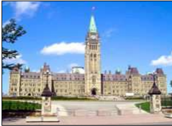
Blocul Central al Parlamentului Canadian, Colina Parlamentului, Ottawa, Ontario.

Patrierea Constituției a inclus și adoptarea Cartei Canadiene a Drepturilor și Libertăților, care garantează drepturi și libertăți fundamentale și care nu poate fi, în mod normal, ignorate de nici unul dintre organismele legislative canadiene. Carta conține, totuși, o clauză care permite parlamentelor federal și provinciale să promulge legi contrare unora dintre articolele Cartei, în mod temporar, pentru perioade de câte cinci ani.