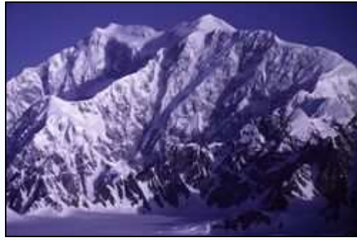
Muntele Logan în Teritoriul Yukon; la 5.959 metri, cel mai înalt punct din Canada și al doilea din America de Nord.

Flora nordului canadian devine din ce în ce mai rarefiată de la păduri de conifere la tundră și, în final, pământuri lipsite de vegetație în nordul extrem. Nordul continental este încercuit de un vast arhipelag încorporând unele dintre cele mai mari insule din lume.