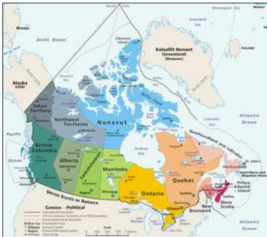
O hartă geopolitică a celor 13 diviziunilor administrative subnaționale de prim rang ale Canadei.