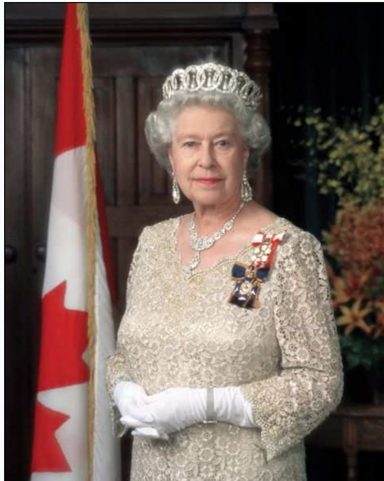
Regina Elisabeta a II-a, Regina Canadei.