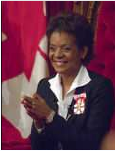
Michaëlle Jean, Guvernatoarea Generală a Canadei.

Canada este o monarhie constituțională și o țară a Commonwealth-ului care o recunoaște în mod formal pe Regina Elisabeta a II-a a Regatului Unit ca Regină a Canadei, ale cărei funcții de zi cu zi sunt îndeplinite de către un Guvernator General la nivel federal și de către un Locotenent-Guvernator la nivelul fiecărei provincii. Chiar dacă Guvernatorul General a preluat multe dintre funcțiile șefului statului, monarhul rămâne din puncte de vedere constituțional șeful statului canadian. Astfel, funcțiile oficiale ale guvernului și chemările la urne sunt exercitate, iar legile sunt promulgate, în numele Suveranului. Regina Elisabeta a II-a este suveranul Canadei din 6 februarie 1952.