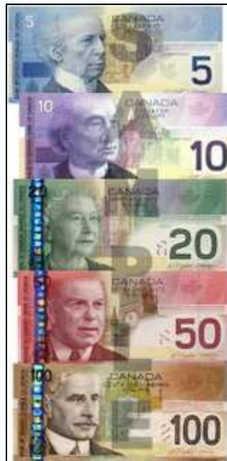
Cele cinci denominații ale bancnotelor canadiene, înfățișând (de sus în jos): Wilfrid Laurier, John A. Macdonald, Regina Elisabeta a II-a, William Lyon Mackenzie King, și Robert Borden.

Canada este una dintre cele mai bogate națiuni ale lumii, membră a Organizației pentru Cooperare Economică și Dezvoltare (OECD) și G8. La fel ca în alte țări dezvoltate, economia canadiană este dominată de sectorul de servicii, în care lucrează trei sferturi din populație.