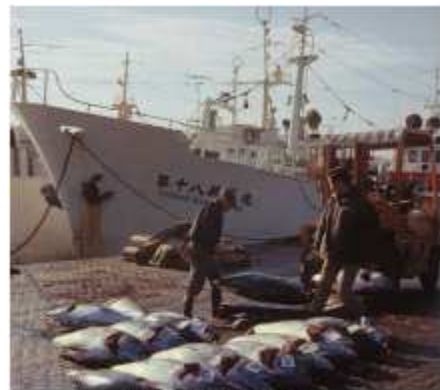
Comerțul cu ton

Yokohama este speciala prin mai multe lucruri. In primul rand, asa cum spuneam faptul ca dezvoltarea acestui oras (acum aproape inclus in Tokyo, fiind populata intreaga distanta dintre