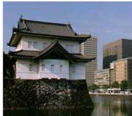
Zidul Palatului Imperial

de Palatul Imperial este districtul Marunouchi, cel mai mare centru de afaceri. Mai la est se află centrul comercial cel mai important. La nord de Palatul Imperial se afla Jimbocho, un cartier cu foarte multe librării. Domul Tokyo se află la nord de acest cartier și este o modernă sală sportivă și de concerte.