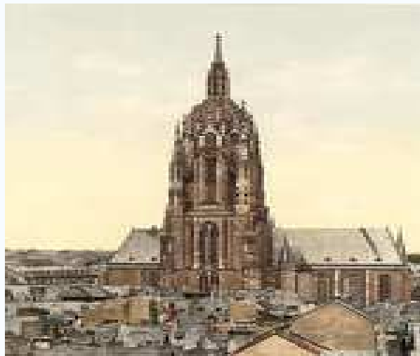
Domul din Frankfurt