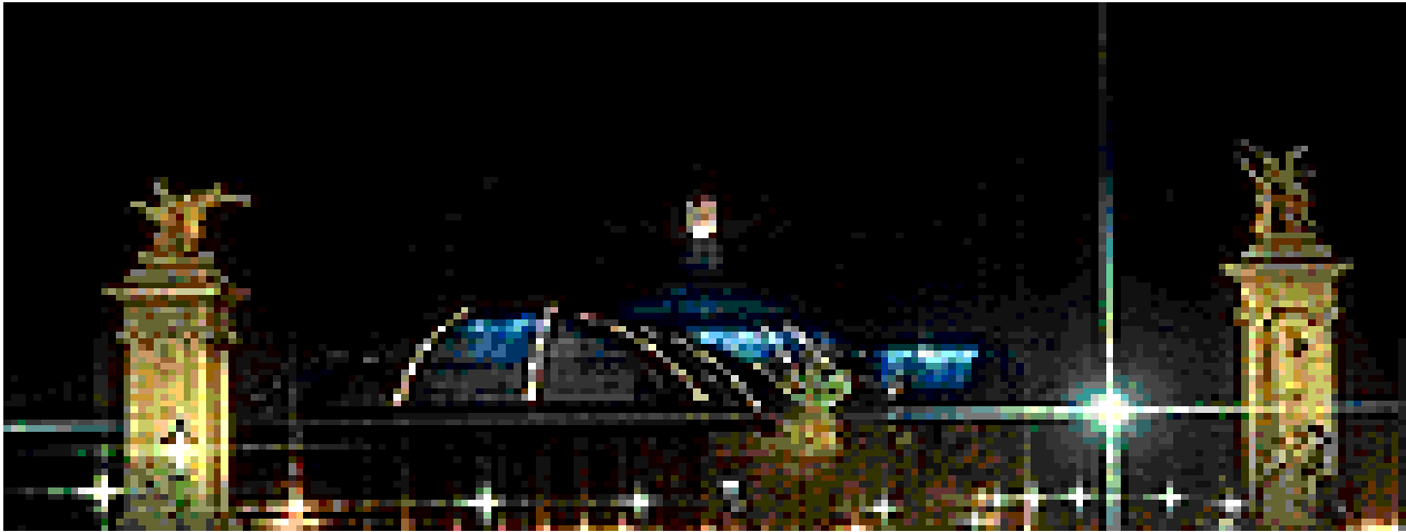
PODUL ALEXANDRU AL III-lea