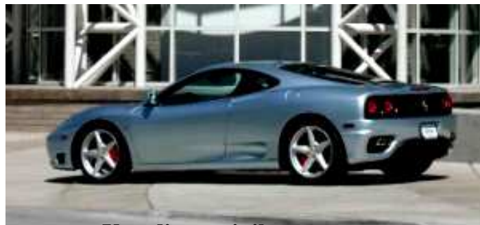
Una din masinile contemporane

2001 Ferrari 360 Modena F1 grigio alloy