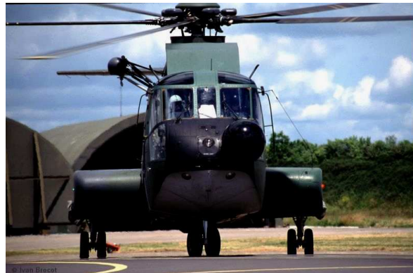
Cele mai contemporane elicoptere

Dintre statele cu o industrie de avioane mai tinara se evedentiaza Polonia(al patrulea mare produc tor de elicoptere  n lume),Cehia,China,Israel,Olanda, Brazilia,Australia,Suedia,Spania,Finlanda,Romania etc.