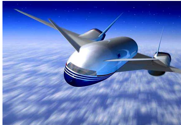
cel mai contemporan avion

Industria aeronautica, care include nu numai producerea de avioane ,dar  i de elicoptere,rachete,aparate cosmice este concentrata in tarile inalt dezvoltate. Cel mai mare produc tor de avioane din lume este S.U.A.,cu 18 mii de avioane De pasageri  i 2600 de elicoptere pe an, urmata de statele industriale din Europa, Cu 1200 de avioane de pasageri  i 650 de elicoptere pe an .Dintre tarile Europei mari producatori de avioane s nt Marea Britanie(locul II din lume), Fran a( III ), Germania,Italia.