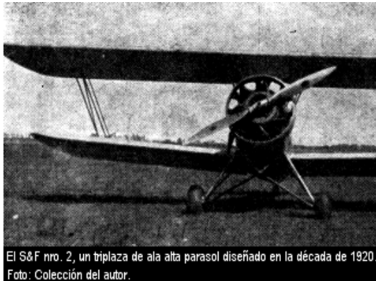
Unul din vechile avioane

Industria aeronautica este una dintre subramurile cele mai moderne ale industriei constructoare de masini. Piata de desfacere a productiei este relativ restrinsa deoarece pretul avioanelor este inalt si chiar si cele mai mari companii de navigatie nu cumpara mai mult de citeva avioane pe an, in timp ce construirea unui anumit tip de avion nu este rentabila dac a nu se produc minimum citeva sute de aparate.