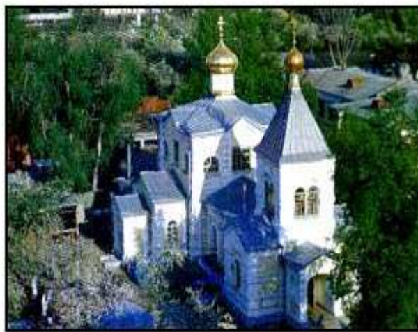
Mănăstirea din orașul Gomel.Punct turistic