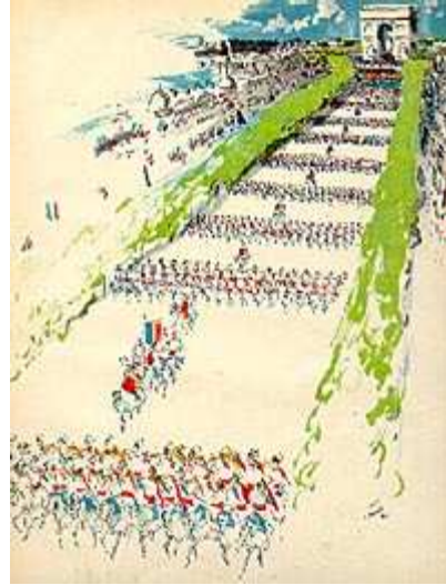
14 juillet 1939 : dernière parade avant l'épreuve du feu.