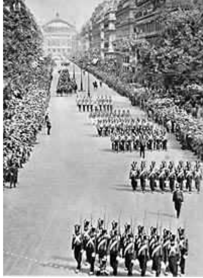
14 juillet 1930 : la crise économique vient de s'abattre sur l'Europe.