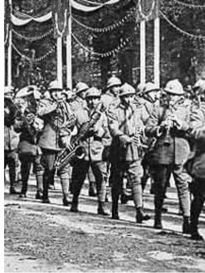
Troupes francaises et troupes italiennes (de gauche a droite) ▲